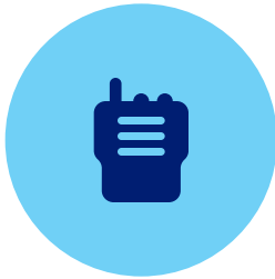
主承包商与分包商之间的沟通